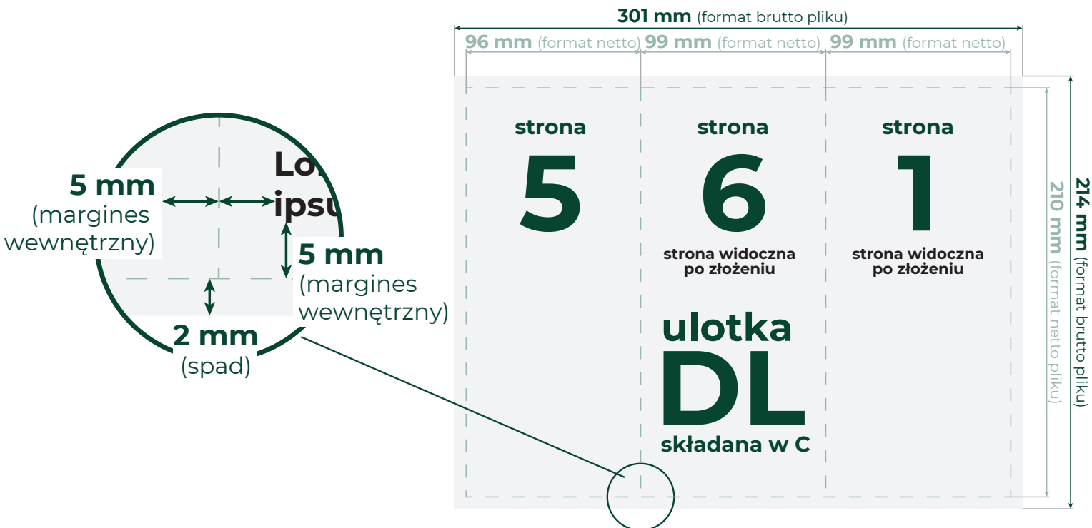
Wizualizacja złożenia ulotki