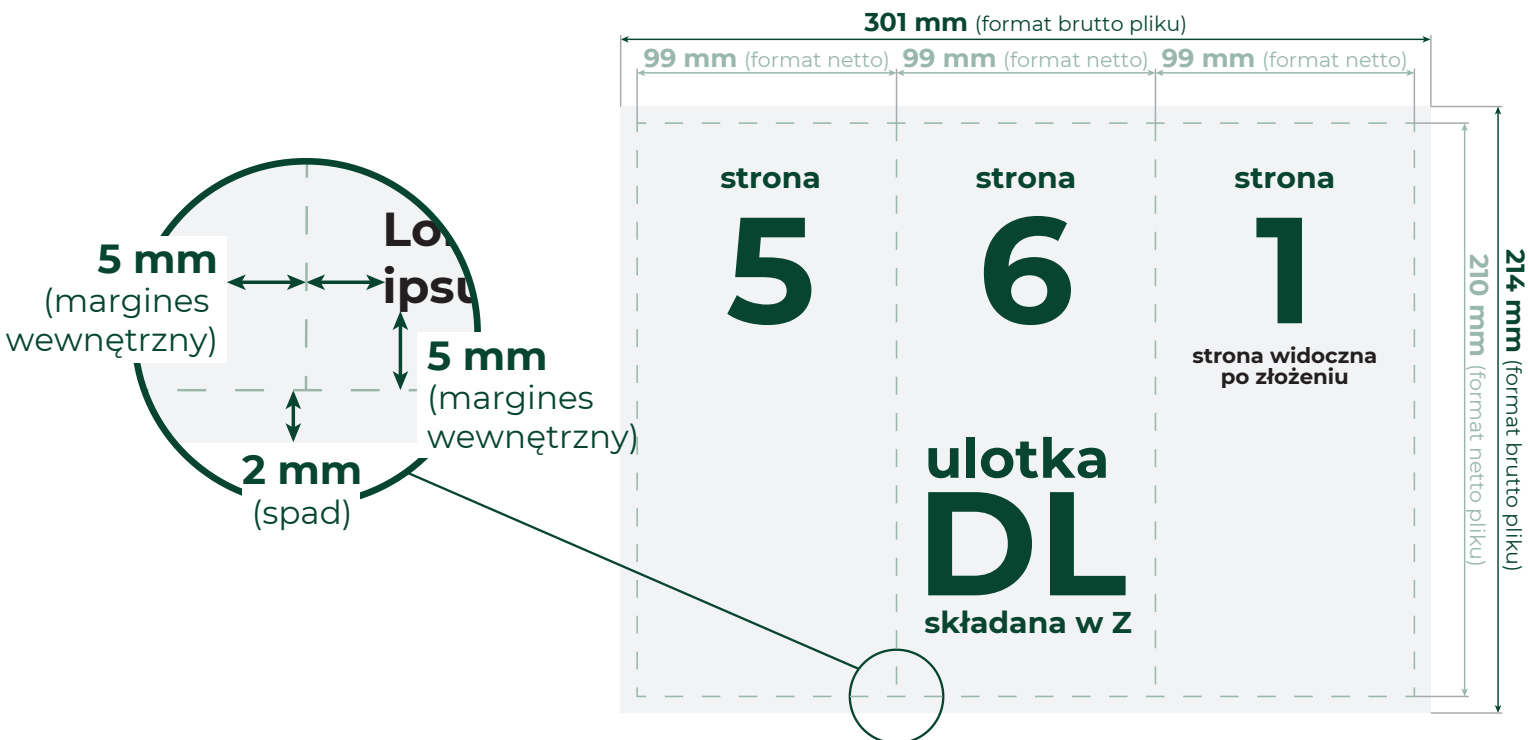
Wizualizacja złożenia ulotki